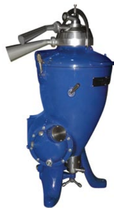
Reformas de Centrífugas de Óleo Vegetal

A MARCENTRIC é uma empresa prestadora de serviços especializada na REFORMA e MANUTENÇÃO de centrífugas para usinas sucroalcooleiras, empresas de bebidas e laticínios, empresas de óleos minerais e comestíveis. Realizamos o REPOTENCIAMENTO de centrífugas e o BALANCEAMENTO DINÂMICO COMPUTADORIZADO de tambores, rotores, acoplamentos e peças rotativas em geral. Todos os serviços descritos são cobertos pela " GARANTIA MARCENTRIC ".