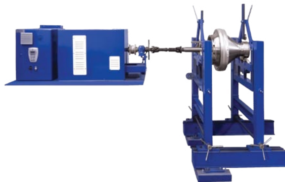
Balanceadora Dinâmico Industrial