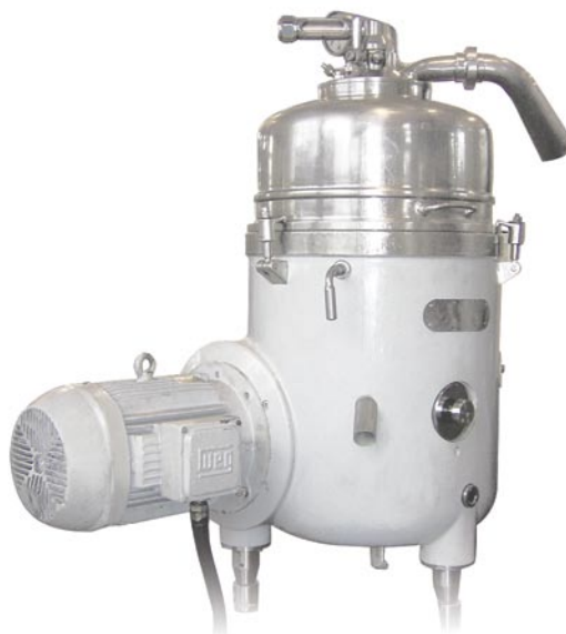
Reformas de Centrífugas de Óleo Vegetal